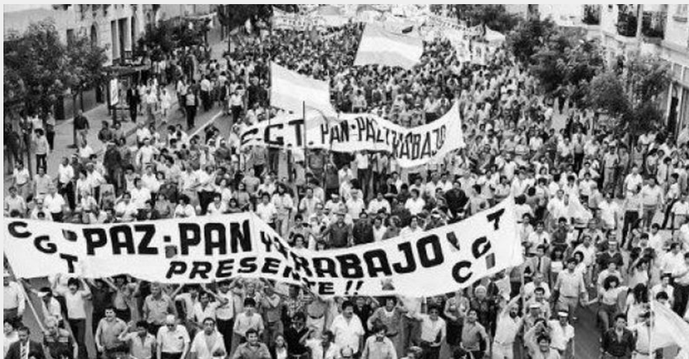
Marcha “Paz, Pan y Trabajo”, 30 de marzo de 1982

La tercera causa de la crisis de la dictadura estuvo asociada con la guerra de Malvinas iniciada el 2 de abril de 1982. El 14 de junio, luego de cruentos enfrentamientos, el gobernador militar de Malvinas, Mario Benjamín Menéndez, firmó el cese de fuego ante Inglaterra. Con la vuelta de los soldados, comenzaron a darse a conocer las deplorables condiciones que se habían vivido en las islas, que incluían falta de alimentos y de elementos para abrigarse, así como malos tratos por los superiores. La derrota precipitó la caída de la dictadura. Amplios sectores sociales, que habían acompañado la decisión de recuperar las islas, consideraron que las Fuerzas Armadas nacionales habían fallado en su función específica, además de sentirse engañados por los medios de comunicación y el propio gobierno.